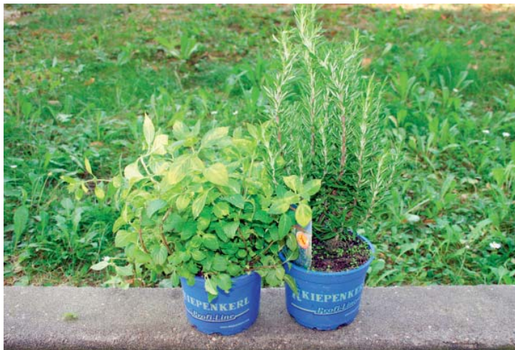
Rostliny zařazené do nového prodejního konceptu společnosti Bruno Nebelung GmbH & Co. KG jsou prodávány v modrých kontejnerech pod obchodní značkou Kiepenkerl Profi – Line