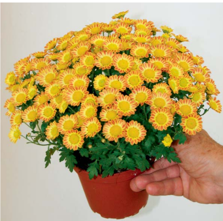
Novinkou společnosti Kaňák jsou Chrysanthemum skupiny Micronette

Společnost Jan Kaňák se sídlem v Dolanech u Olomouce dováží z Nizozemska mladé rostliny k dopěstování a na požádání i osiva letniček a balkonových rostlin. Na veletrhu Zelený svět představili zajímavou novinu – hrmkovou Alstroemeria s obchodním názvem Inticancha . Jedná se o novou nádobovou rostlinu kvetoucí od jara do podzimu. V nabídce je ve čtyřech barevných variacích směřujících k červené a bílé. Pro množství květů a kompaktní vzhled si ji zákazníci jistě brzy oblíbí. Další novinkou v sortimentu jsou Chrysanthemum skupiny Micronette s netradičními kombinacemi barev květů.